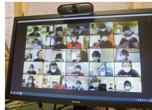
30名以上が参加する運営会議の様子