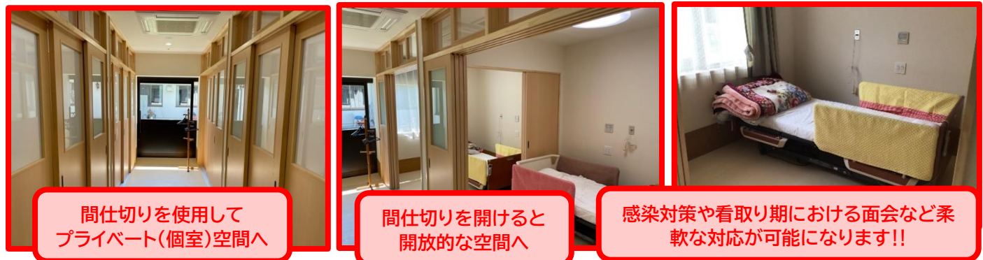
間仕切りを使用してプライベート(個室)空間へ