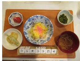
ひなまつりにはちらし寿司